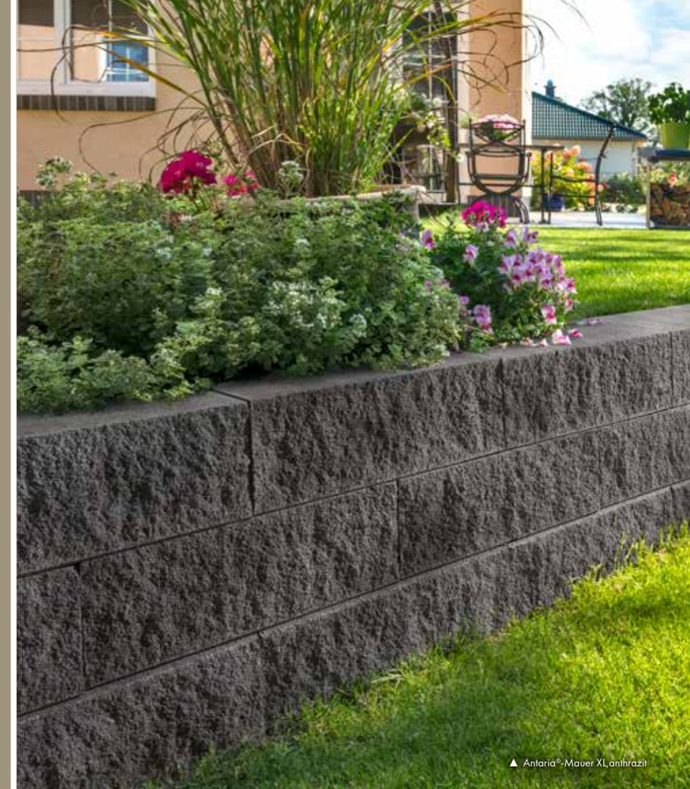
▲ Antaria®-Mauer XL, anthrazit

Art.-Nr. Grau Grundelement, 6150765 GE Abdeckstein 6150774 End-Element, 6150772 EE Abdeckstein 6150773 Halb-/End-Element, 6150766 HE Abdeckstein 6150770