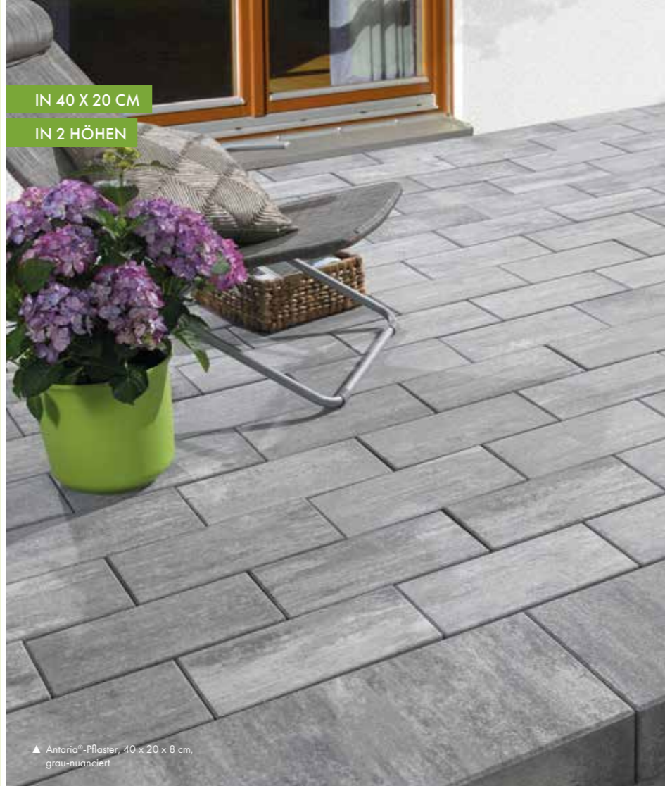
▲ Antaria®-Pflaster, 40 x 20 x 8 cm, grau-nuanciert