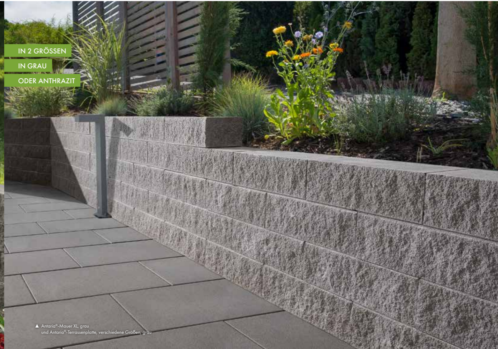
▲ Antaria®-Mauer XL, grau und Antaria®-Terrassenplatte, verschiedene Größen, grau