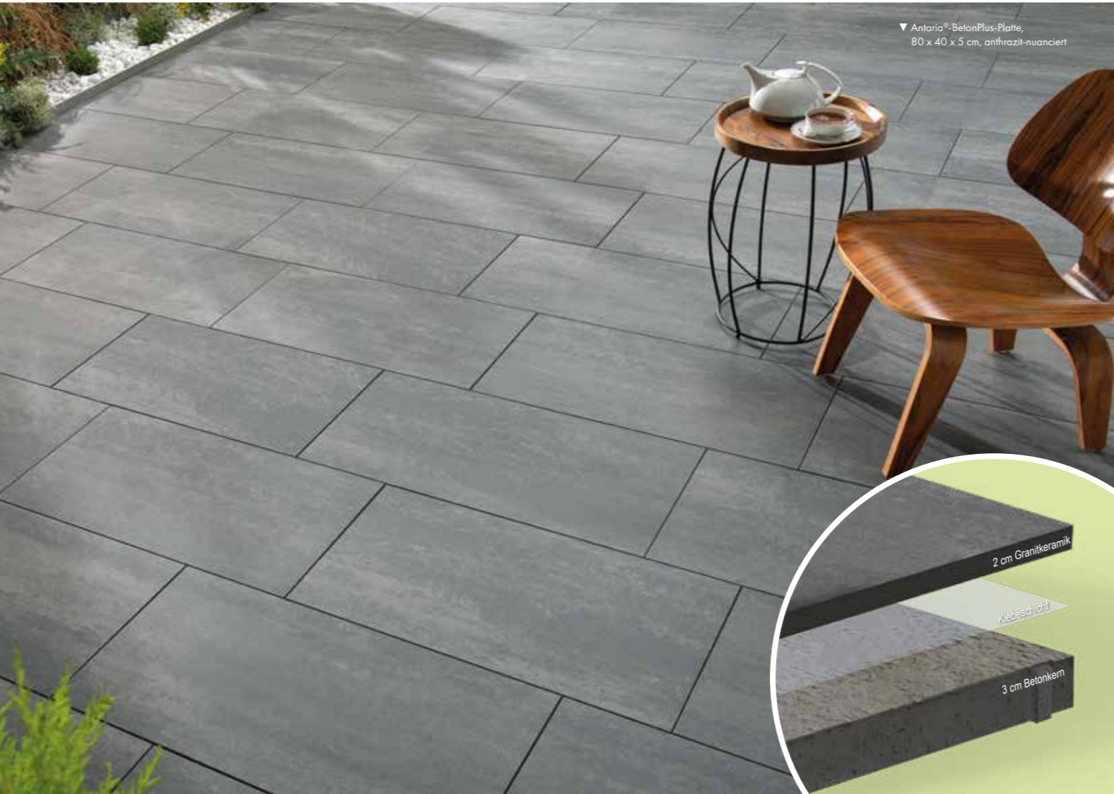
▼ Antaria®-BetonPlus-Platte, 80 x 40 x 5 cm, anthrazit-nuanciert