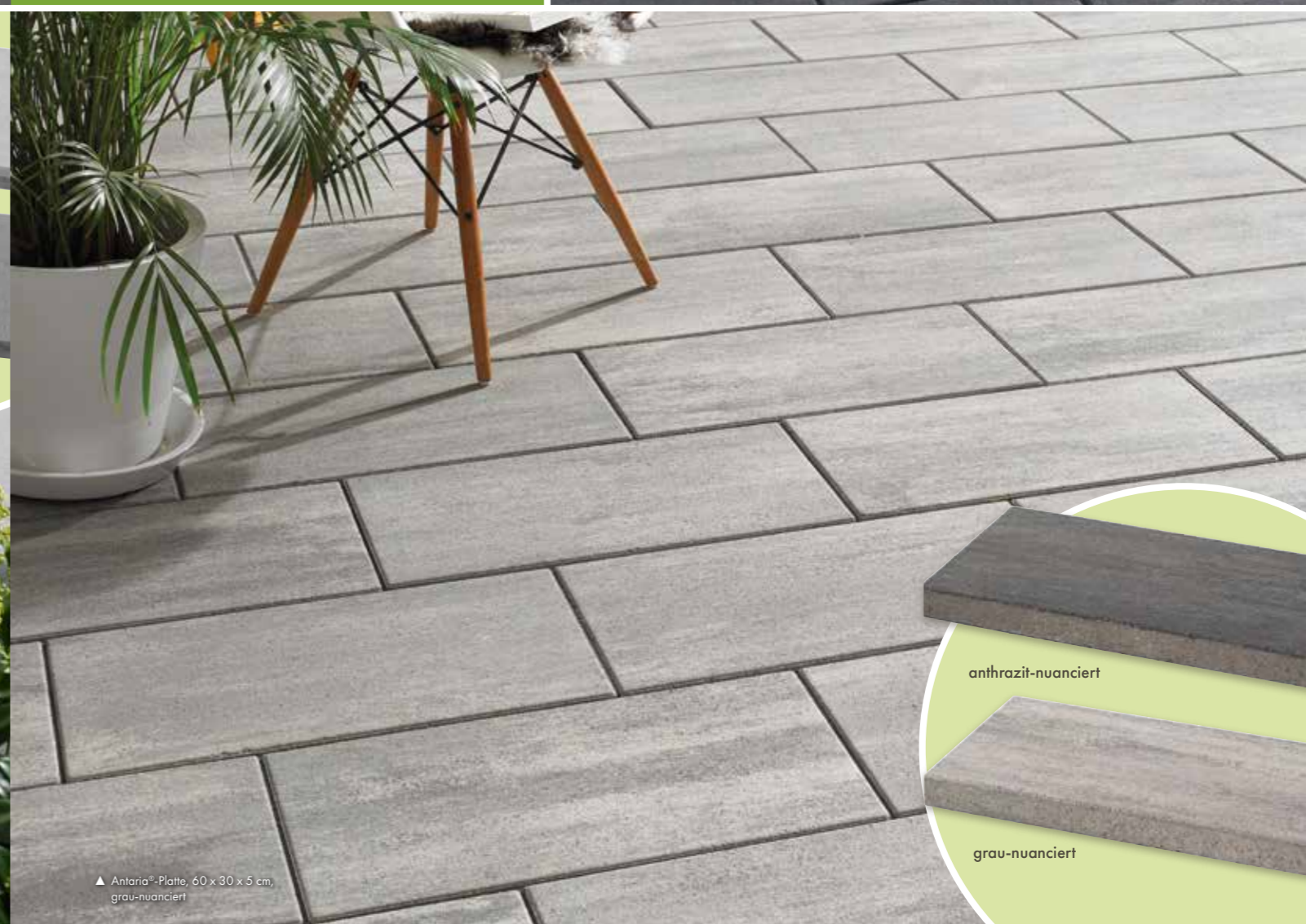
▲ Antaria®-Platte, 60 x 30 x 5 cm, grau-nuanciert