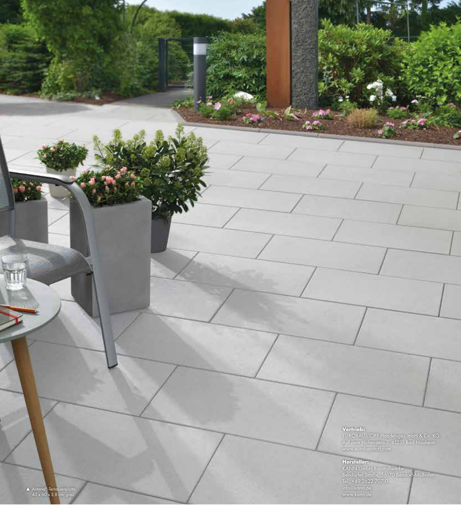
▲ Antaria®-Terrassenplatte, 40 x 60 x 3,8 cm, grau

Vertrieb: EUROBAUSTOFF Handelsges. mbH & Co. KG Auf dem Hohenstein 2, 61231 Bad Nauheim www.eurobaustoff.com