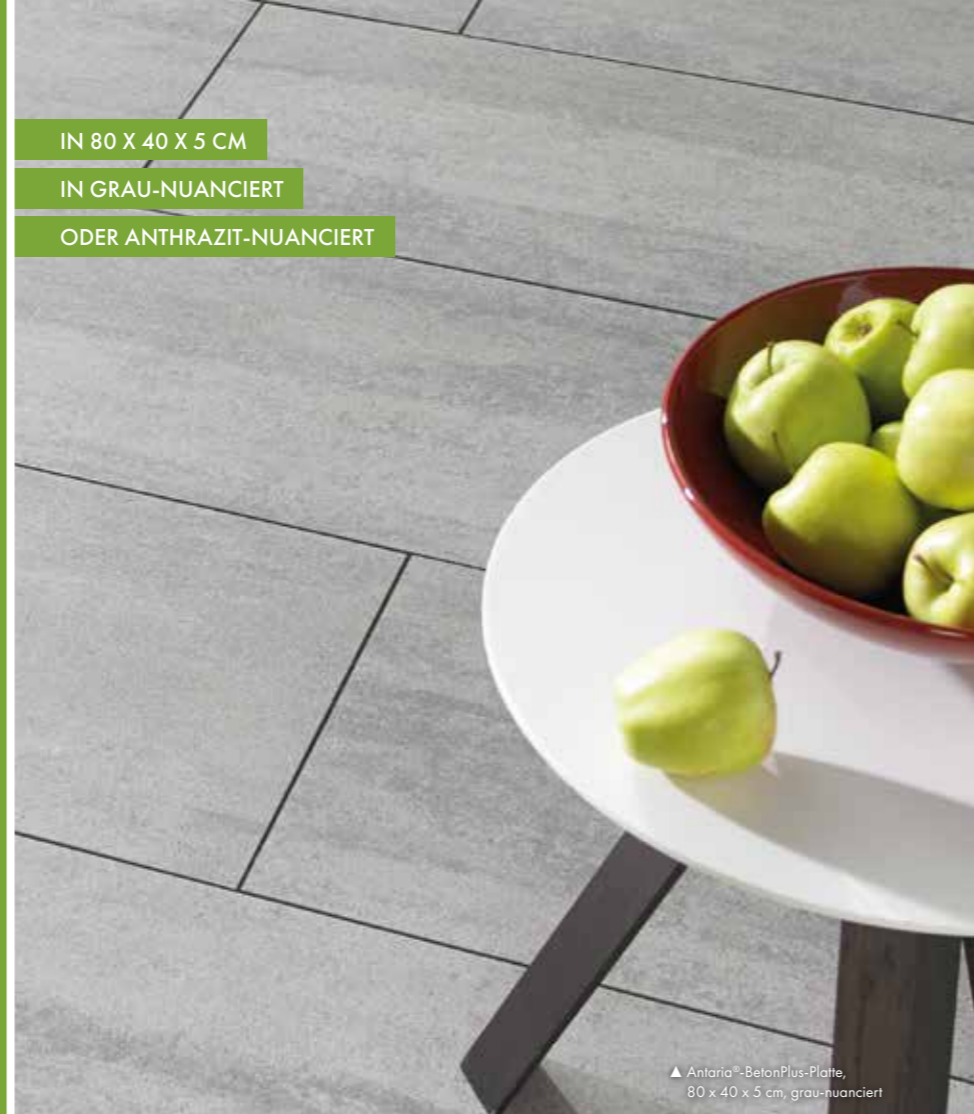
▲ Antaria®-BetonPlus-Platte, 80 x 40 x 5 cm, grau-nuanciert