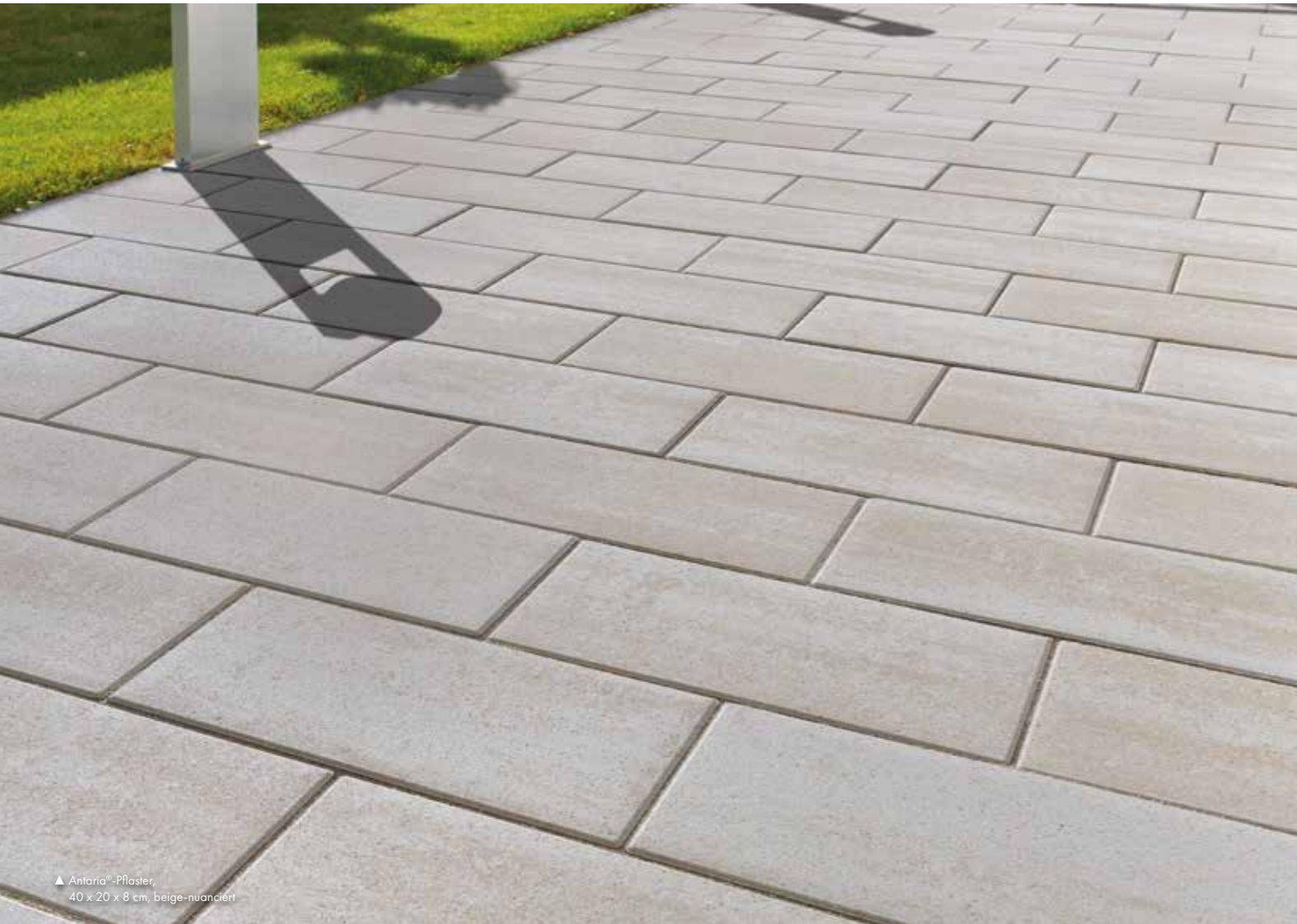
▲ Antaria®-Pflaster, 40 x 20 x 8 cm, beige-nuanciert