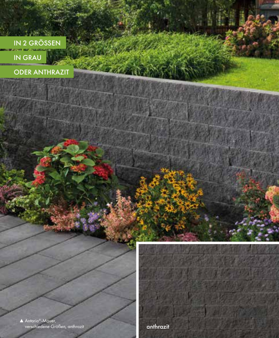
▲ Antaria®-Mauer, verschiedene Größen, anthrazit