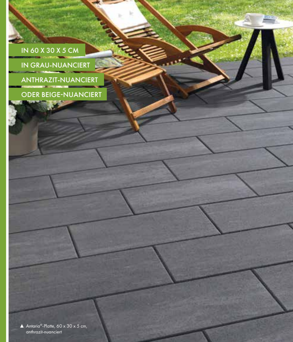
▲ Antaria®-Platte, 60 x 30 x 5 cm, anthrazit-nuanciert

IN 60 X 30 X 5 CM IN GRAU-NUANCIERT ANTHRAZIT-NUANCIERT ODER BEIGE-NUANCIERT