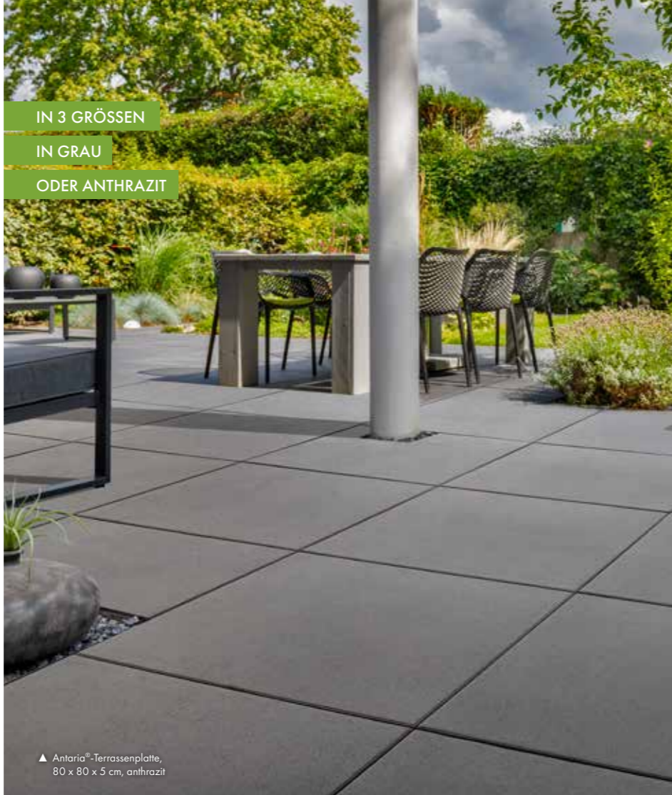
▲ Antaria®-Terrassenplatte, 80 x 80 x 5 cm, anthrazit