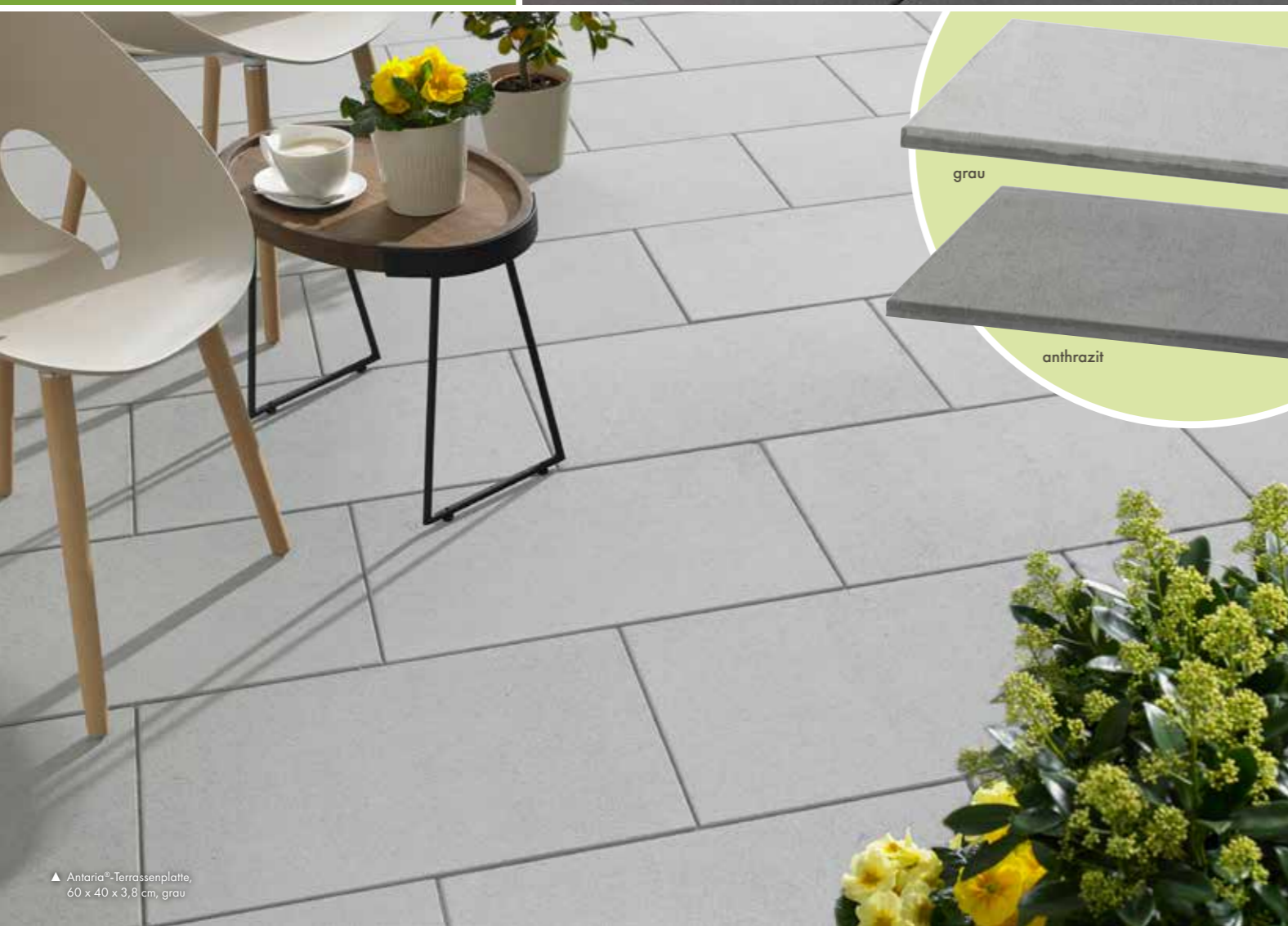
▲ Antaria®-Terrassenplatte, 60 x 40 x 3,8 cm, grau