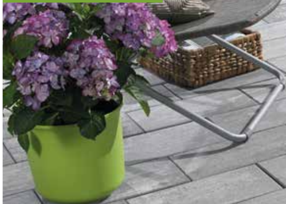
▲ Antaria®-Pflaster, 40 x 20 x 8 cm, grau-nuanciert