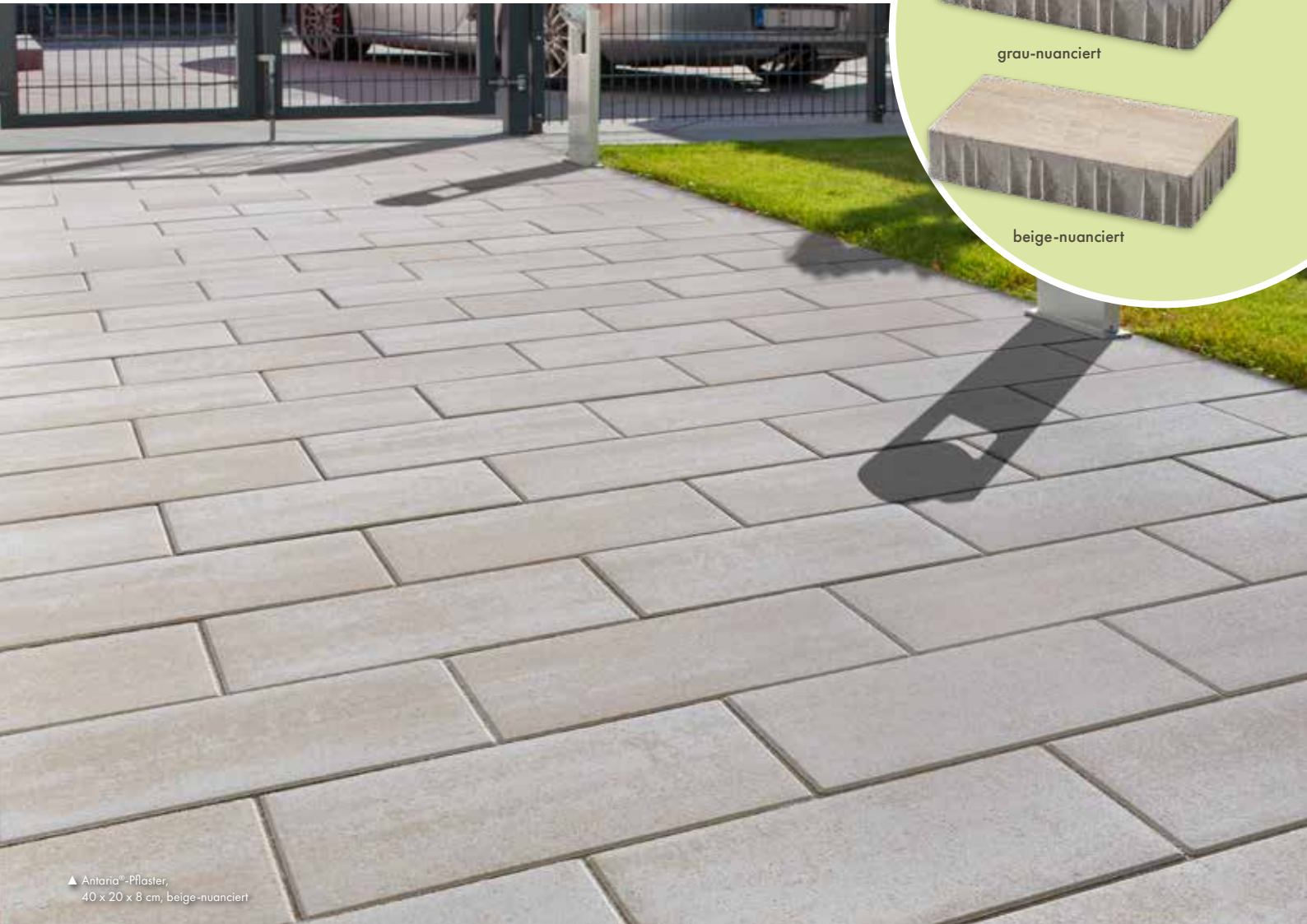
▲ Antaria®-Pflaster, 40 x 20 x 8 cm, beige-nuanciert