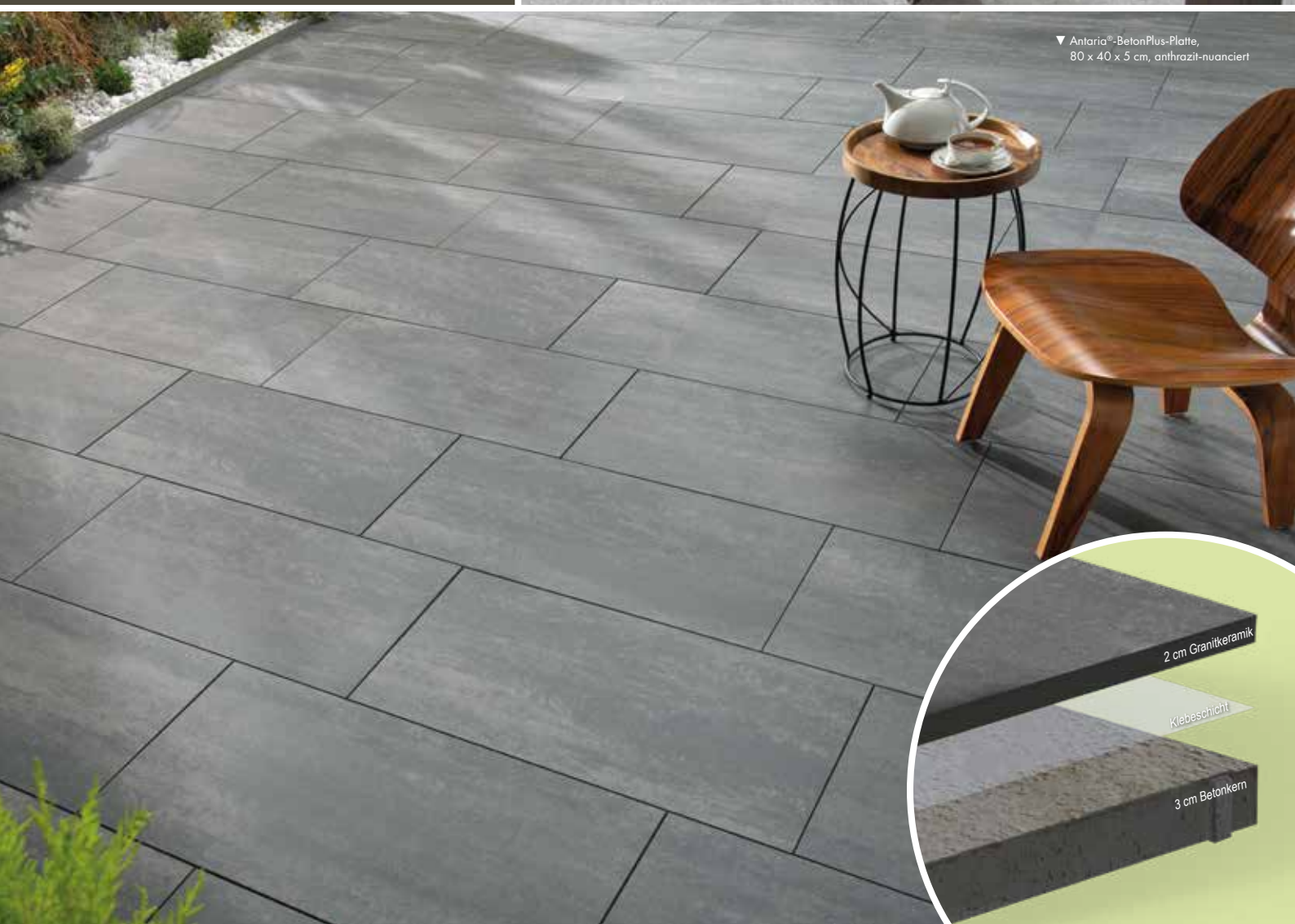
▼ Antaria®-BetonPlus-Platte, 80 x 40 x 5 cm, anthrazit- nuanciert