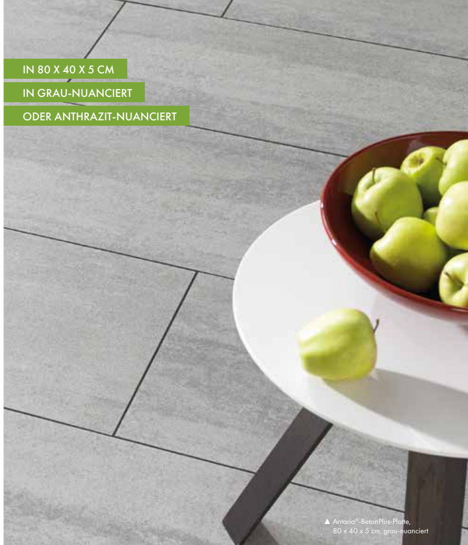
▲ Antaria®-BetonPlus-Platte, 80 x 40 x 5 cm, grau- nuanciert